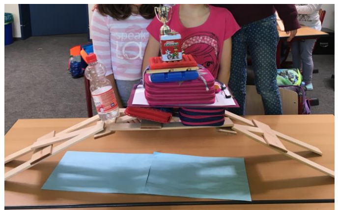
Fotos: Belastungstest der Leonardobrücke